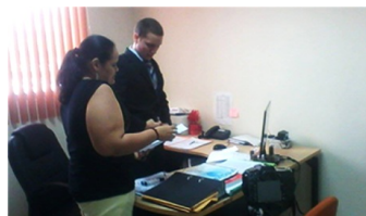
Figura 4.3: Producción 03

Se explicó detalladamente al protagonista, los movimientos, diálogos, se le proporcionó el vestuario y el maquillaje adecuado para la interpretación. Luego se grabaron varias tomas de cada una de las escenas a realizar, para su posterior edición. 1