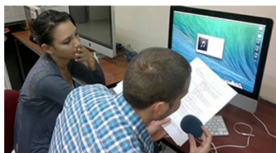
Figura 4.7: Producción 07

Estos son detalles que se registran en el material digital para su posterior edición. (Se capturó la imagen con un dispositivo móvil). 3