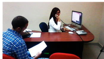
Figura 4.1: Producción 01

En el rodaje se grabarán las imágenes y el sonido necesarios para la posterior edición de vídeo y audio, siempre teniendo presentes como criterios de captación las últimas tendencias estéticas audiovisuales del momento. Empleamos para ello cámaras digitales de alta definición y sistemas de apoyo de la más moderna tecnología (Nikon D3500). Al acabar esta fase ya disponemos de todo el material original necesario para empezar con la edición del vídeo. ( 13 Etapas de Producción de Vídeos. MEDIACLUB. 2010. Consulta realizada en noviembre del 2014.).