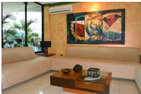
Figura 3. Set 1 - Sala

Se tendrán dos sets para la realización del programa. El primer set es una sala, la cual será usada para el segmento de entrevistas; y el segundo set es un comedor adecuado para demostraciones sobre la preparación de alimentos. Ambos sets cuentan con ventanales por donde ingresa luz natural y además se usa luz artificial.