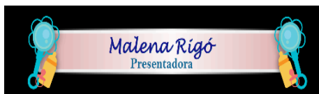
Figura 2. Claqueta del Programa

Las claquetas fueron diseñadas con elementos infantiles, tales como: biberones y chinoscos. Estas serán usadas para presentar en pantalla el nombre de la conductora, nombres de invitados y otros datos importantes.