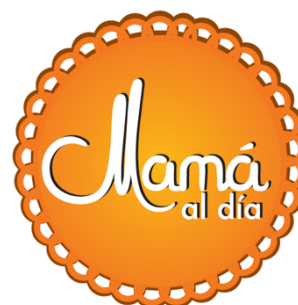
1. Logo del Programa

La primera figura es de color café y sobre esta se ubica el segundo círculo de color naranja. La última figura, que se ubica sobre las dos anteriores, es un círculo de color naranja sin borde externo, con un gradiente de amarillo y naranja para mostrar profundidad. El texto en su interior consiste en la palabra “Mamá”, con fuente Margherite. En la parte inferior de esta palabra, alineado desde el centro hacia la derecha, aparecen las palabras “al día” con fuente Futura. Todas las letras son de color blanco con fondo negro.