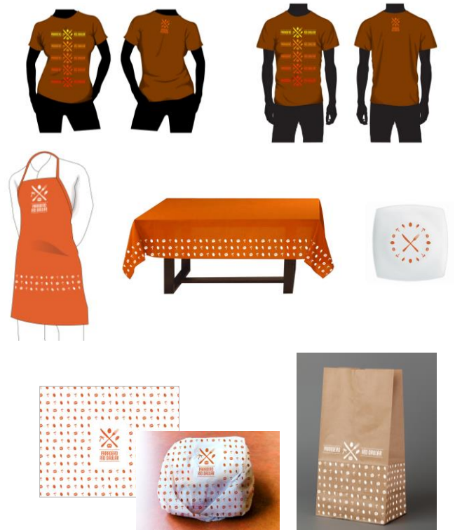
Figura 2. Marketing