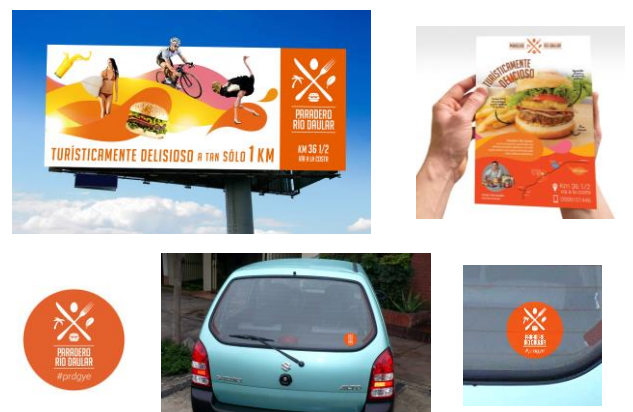
Figura 3. Publicidad