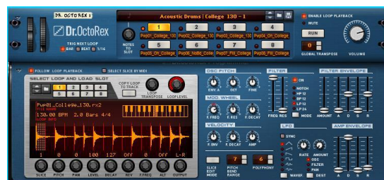
Figura 3. Dr. Octo Rex de Reason

La creación de los bancos sonoros está planificada para su uso en los dispositivos (instrumentos virtuales) característicos del programa Reason: Dr. Octo Rex, sampler NN-19 y NN-XT.