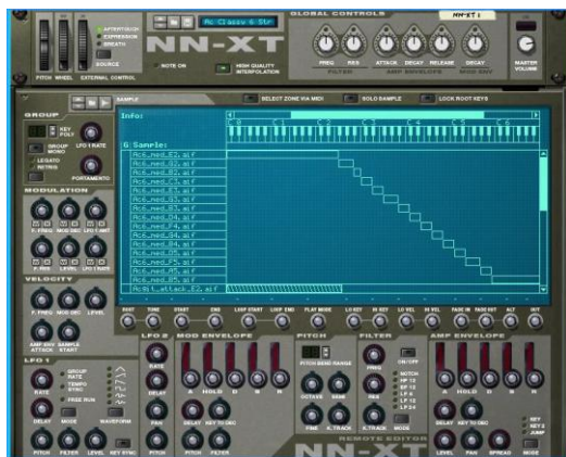
Figura 5. Sampler NN-XT de Reason

Los bancos sonoros están contenidos en un archivo 'ReFill', el cual lo generamos gracias al ReFill Packer, un programa que permite crear librerías de sonido personalizadas para su uso en Reason. Un 'ReFill' puede contener muestras, loops y canciones. El programa está disponible en descarga gratis para todos los usuarios de Reason.