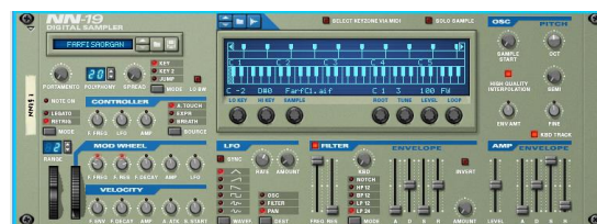
Figura 4. Sampler NN-19 de Reason