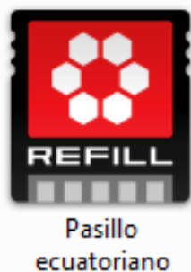
Figura 6. Archivo ReFill del Pasillo ecuatoriano

Los bancos sonoros están contenidos en un archivo 'ReFill', el cual lo generamos gracias al ReFill Packer, un programa que permite crear librerías de sonido personalizadas para su uso en Reason. Un 'ReFill' puede contener muestras, loops y canciones. El programa está disponible en descarga gratis para todos los usuarios de Reason.