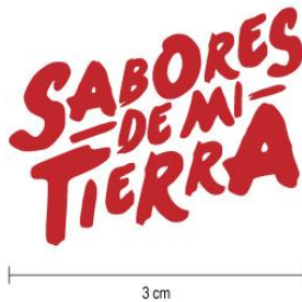
Figura 4. Tamaño mínimo

El logo nunca debe ser reproducido a menos de 3 cm. Por debajo de esa medida el logo pierde visibilidad.