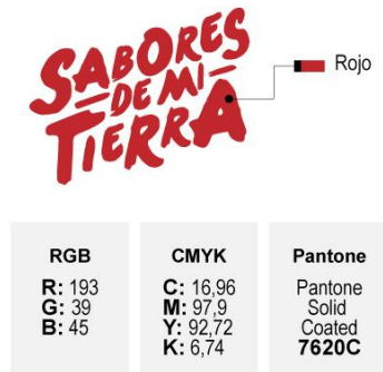
Figura 3. Color

Para un adecuado uso del logo y su correcta presentación en cualquier medio, sea este digital o impreso, cada modo de color (RGB, CMYK y Pantone) debe tener valores exactos y equivalentes entre sí. A continuación se detallan los valores: