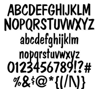
Figura 2. Tipografía Franciscan Regular

Adicionalmente, por cuestiones de legibilidad, se ha decidido incluir una segunda tipografía que sirva de complemento a la primera, para uso en textos largos, párrafos o similares que acompañen al logo. El nombre de la tipografía es “Franciscan Regular”.