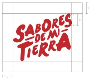
Figura 5. Tipografía Franciscan Regular

Esta área es un espacio de seguridad que debe rodear el logo y no ser invadida por ningún elemento gráfico. Es importante respetar este margen ya que asegura la óptima visualización del logo. En este caso la medida del área de protección es la altura de x.