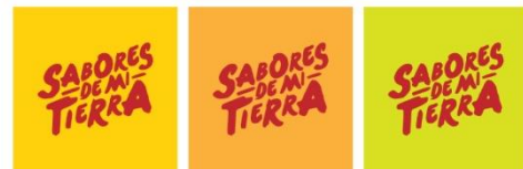
Figura 7. Aplicación sobre color