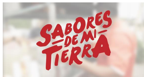
Figura 8. Aplicación sobre imagen